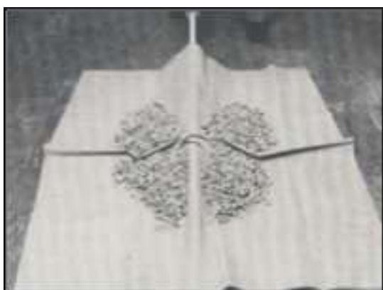
การแบ่งสี่ (Quartering)