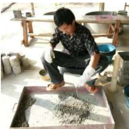
3. เติมน้ำหลังจากผสมดินกับซีเมนต์ให้เข้ากันแล้ว