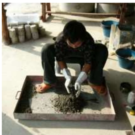
4. คลุกเคล้าส่วนผสมทั้งหมดให้เข้ากัน