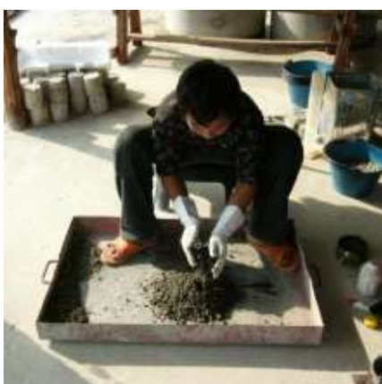
5. เก็บตัวอย่างไปหาค่าความชื้น