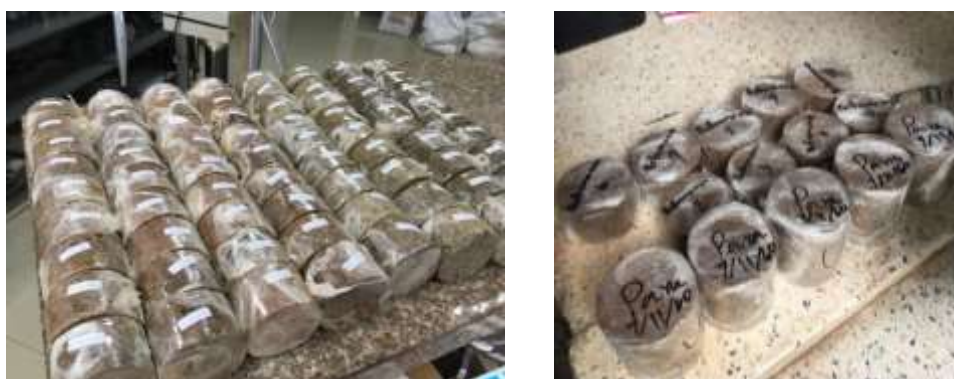
รูปที่ 5 แสดงการเตรียมก้อนตัวอย่างเพื่อนำมาทดสอบคุณสมบัติเชิงวิศวกรรมในห้องปฏิบัติการ

การบันทึกผล ให้บันทึกผลการทดลองตามตารางแนบ