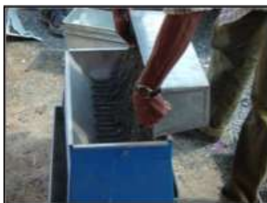
เครื่องแบ่งตัวอย่าง (Sample Splitter)