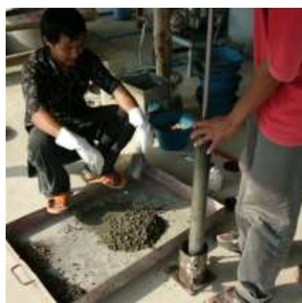
6. บดอัดแท่งตัวอย่าง

รูปที่ 2 แสดงขั้นตอนการทำแท่งตัวอย่างในห้องปฏิบัติการ