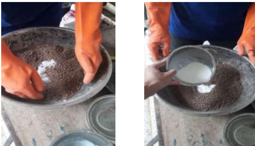
รูปที่ 4 แสดงการผสมน้ำยางพาราผสมสารผสมเพิ่มกับดินซีเมนต์