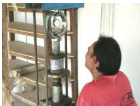
รูปที่ 3 แสดงการทดลองหาค่ากำลังรับแรงอัดของดินซีเมนต์ผสมยางพาราโดยวิธี Unconfined Compressive Test