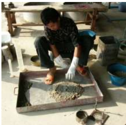
1. เทส่วนผสมดินกับซีเมนต์