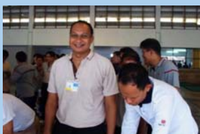
ทดสอบสมรรถภาพ หน้า ๓