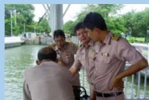
สำรวจพื้นที่ ท่าवासูกกรี หน้า ๔