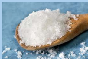
สารละลาย หน้า ๓