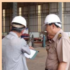
เรือตรวจการณ์ไกลฝั่ง หน้า ๒