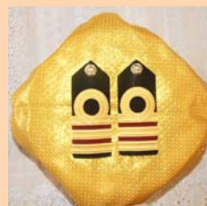
ประดับเครื่องหมายศ หน้า ๓