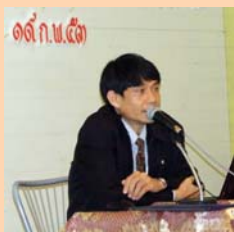
อนุรักษ์พลังงาน หน้า ๒