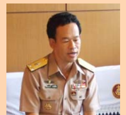
วารสารเพื่อนสเดนเลส หน้า ๔