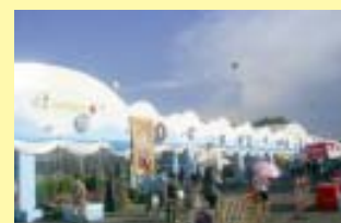
จก.ชย.ทร. ตรวจสอบความก้าวหน้าการก่อสร้างร้านฯ หน้า ๔