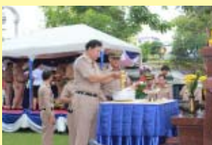
สงกรานต์ ชย.ทร. หน้า ๒