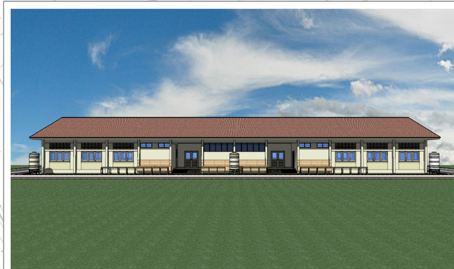
โรงเลี้ยง ๓๐๐ - ๕๐๐ คน