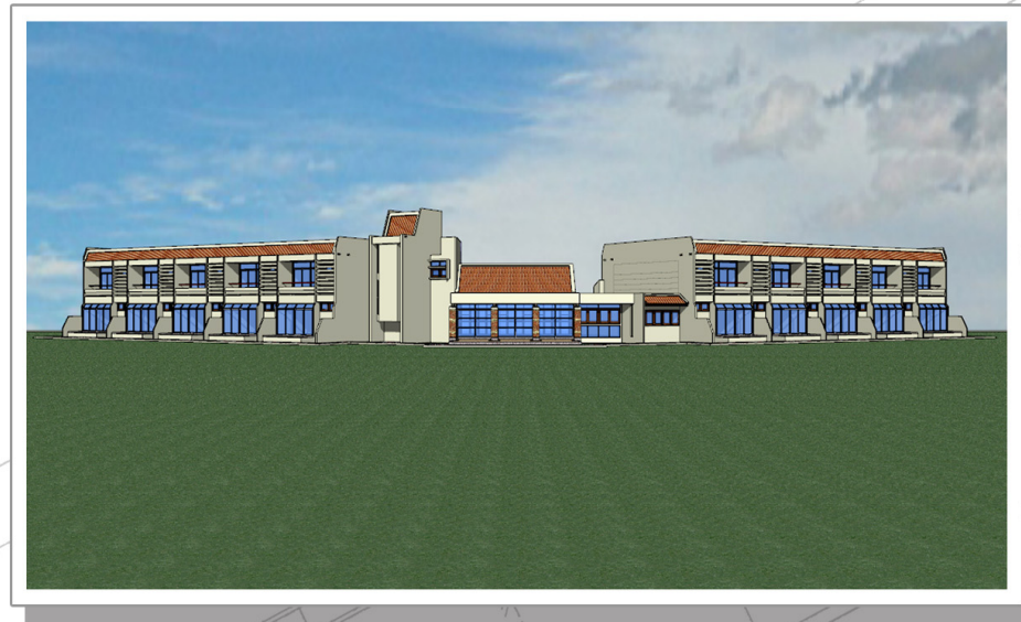
อาคารพักนายนาวาโฮต ๑๐ นาย SOQ (ปีกผีเสื้อ)