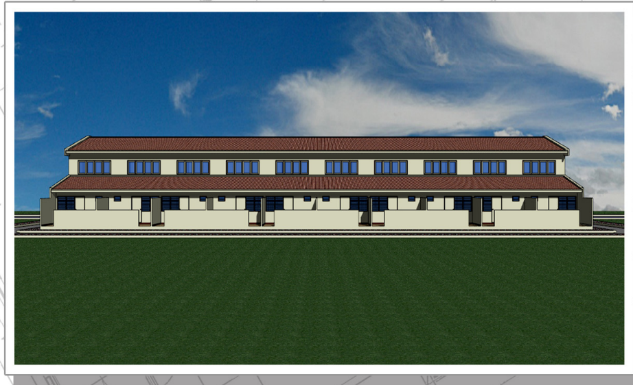
อาคารพักสัณฐานบัตร ๑๐ ครอบครั้ว